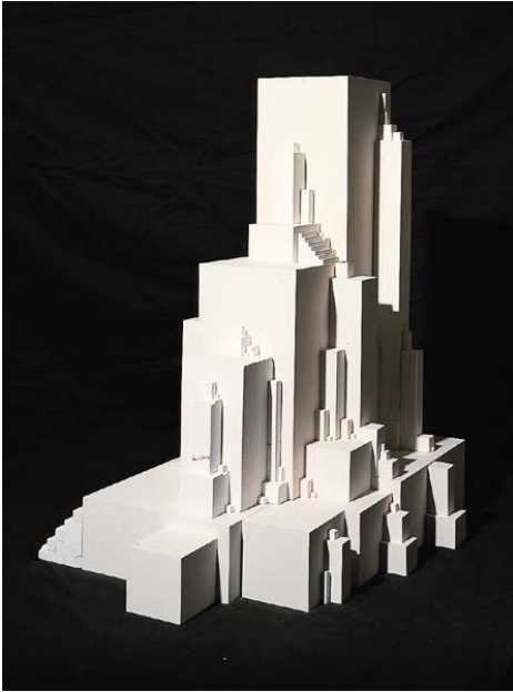
Kazimir Severinovich Malevitch Architectone Zeta 1923-1927. Plâtre

Depuis toujours, le Blanc a été utilisé, comme trait, révélateur de la lumière, soutien de la couleur, mais aussi comme transcendance, pureté, limbe, virginité. Au 20ème siècle il participe à la mort de la peinture et devient support de l'espace, de l'infini, et de fait élément radical de l'art abstrait avec Malévitch qui le théorise. L'avènement du « suprématisme » donne dans la non représentation la possibilité au spectateur d'être à son tour l'artiste, d'avoir sa propre lecture.